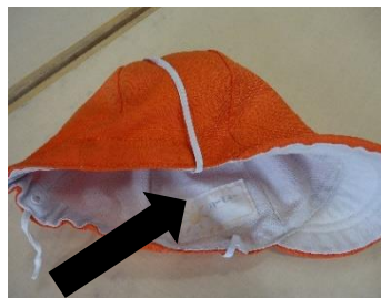
カラー帽子(はな～つき)

※毎週持ち帰り ※タオル地以外のものを使用する場合はご相談ください。 ★薄手の毛布→つきぐみは可 はな、ほしは不可