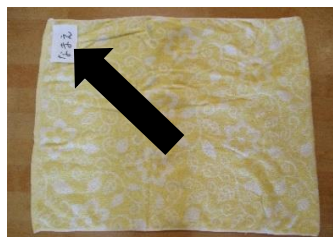
掛けバスタオル(はな～つき)

※毎週持ち帰り ※タオル地以外のものを使用する場合はご相談ください。 ★薄手の毛布→つきぐみは可 はな、ほしは不可