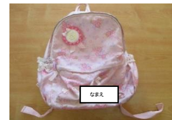
通園リュック(つき)

※毎日の荷物を入れられる大きさのもの(本人が使用できる大きさ) ※キーホルダーやおもちゃは付けしないでください。 ※中身は毎日確認してください。 ※年度の途中から使用します。使用時期になりましたらお知らせします。