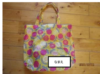
汚れ物入れ袋(はな～つき)