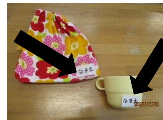
コップ、コップ袋(ほし・つき)