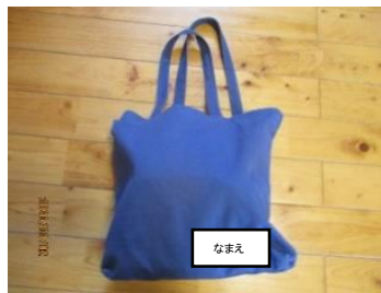
通園バッグ(はな～つき)