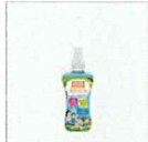
お肌の虫よけ プレシャワーDF ミスト 無香料 80mL