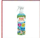
お肌の虫よけ プレシャワーDF ミスト 無香料 200mL